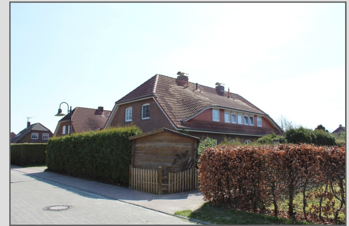
„Ruhig und mit Urlaubsflair“ 26553 Dornum-Schwittersum

Dieses schöne Haus oder auch Feriendomizil befindet sich in Dornum-Schwittersum einem ruhigen und idyllische Wohnort, welcher sich durch seine ländliche Atmosphäre und die Nähe zur schönen Nordseeküste auszeichnet.